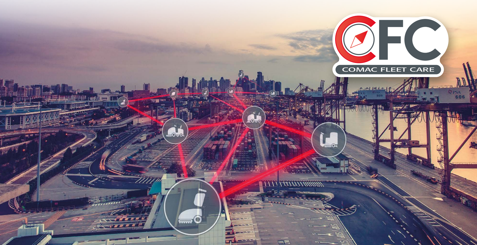
LES TECHNOLOGIES DE VISPA XL