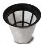
Kit filtre 3833 (FTDP00226)