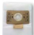
Pochette 10 sacs microfibre (GP 1/16A) SA 101 (KTRI00453)