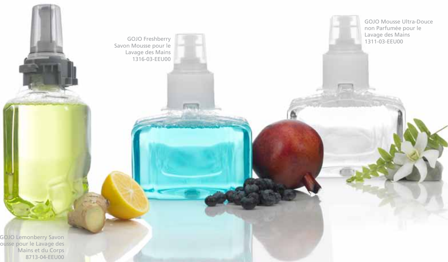
GOJO Lemonberry Savon Mousse pour le Lavage des Mains et du Corps 8713-04-EEU00