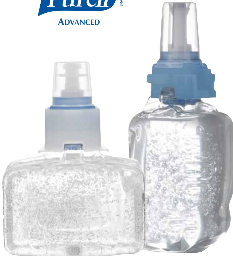
PURELL Advanced Gel hydro-alcoolique pour les mains 1303-03-EEU00