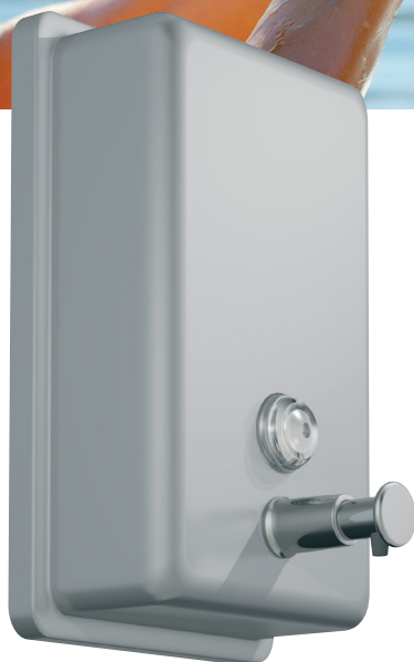
8 44 304