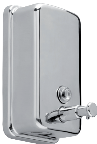
8 44 254