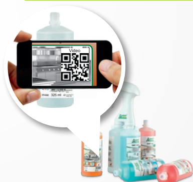
Accès par le QR code