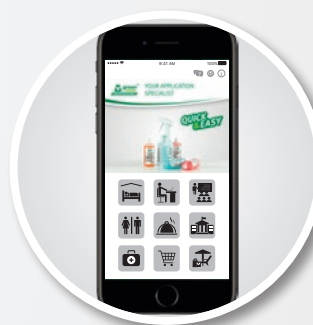
Choix selon les zones d'utilisation

Plateforme de formation bientôt disponible sur