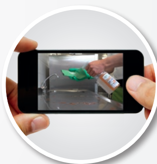
Vidéos en situation